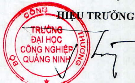
TS. Hoàng Hùng Thắng

- Trong năm học 2023 - 2024 nhà trường đã đầu tư tài liệu, giáo trình bản cứng và bản điện tử đáp ứng chuẩn cơ sở giáo dục theo Thông tư 01/2024-BGDĐT.