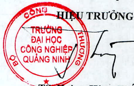
TS. Hoàng Hùng Thắng

- Trong năm học 2023 - 2024 nhà trường đã đầu tư tài liệu, giáo trình bản cứng và bản điện tử đáp ứng chuẩn cơ sở giáo dục theo Thông tư 01/2024-BGDĐT.